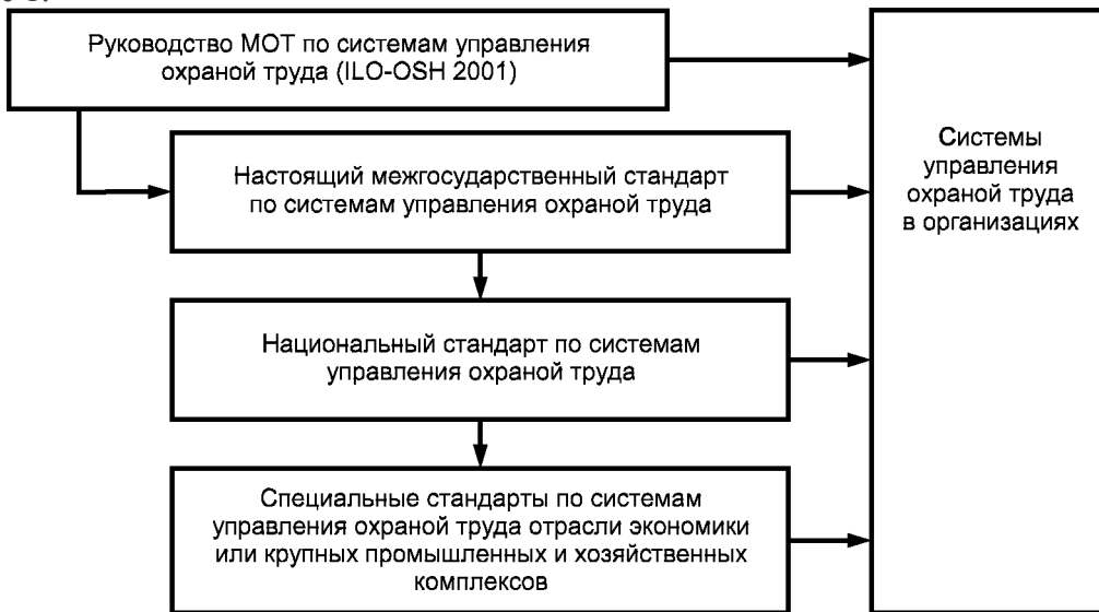
Рисунок 1 — Элементы национальных структур систем управления охраной труда

3.3.2 Элементы национальных структур управления охраной труда и связи между ними представлены на рисунке 1.